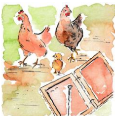
Workshop 2: Herstellung eines antiken Notizblocks