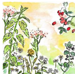
Workshop 4: Duften wie im alten Rom – Salben und Öle